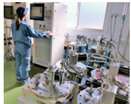
冷凍パワー測定 refrigeration power measurement