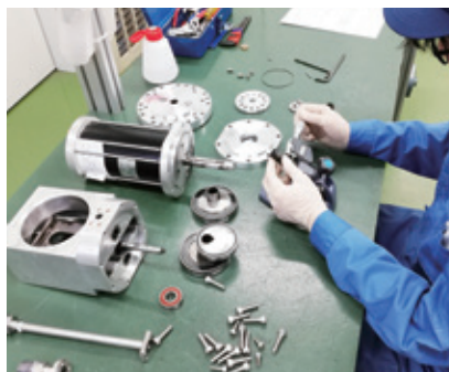
冷凍機メンテナンス cryocooler maintenance