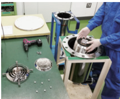
クライオパネルメンテナンス cryopanel maintenance