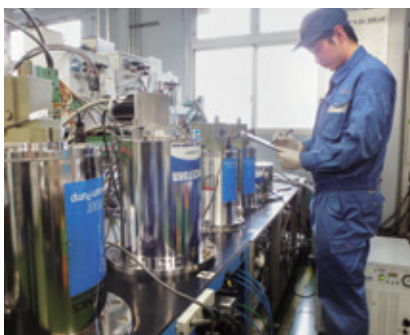
クールダウンテスト cooldown test