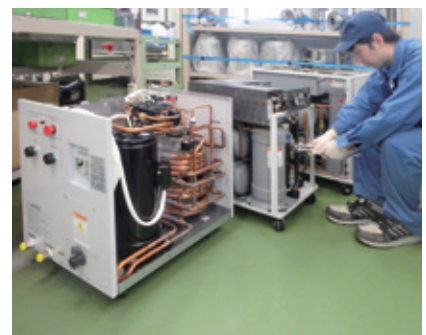
コンプレッサーメンテナンス compressor maintenance