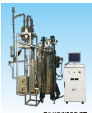
液体窒素循環冷却装置 (液体窒素冷却タイプ)