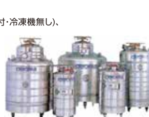
液体ヘリウムデューア