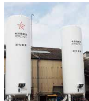
コールドエバポレーター