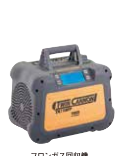
フロンガス回収機