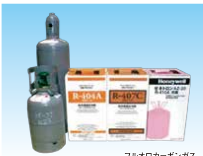
フルオロカーボンガス