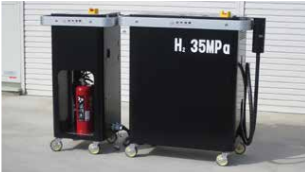
簡易型充填機 ベルステーション MINI35