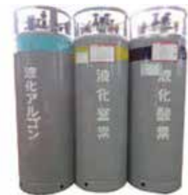
液体ガス可搬式容器