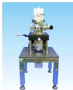
X-Y-Z 軸付きクライオスタット