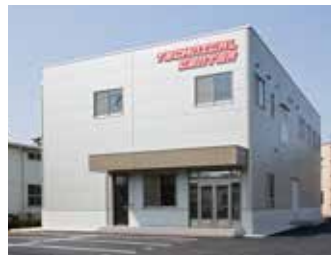
テクニカルセンター