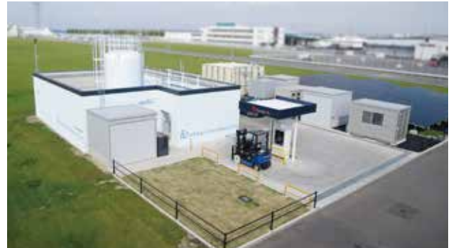
セントレア貨物地区水素充填所