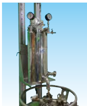
ヘリウム再凝縮装置